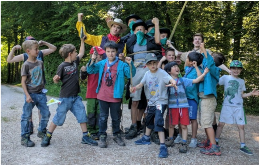
Jens Thiele v/o Riddler

Die Daltons hätten uns fast einen Strich durch die Rechnung gezogen, indem sie Lucky Lukes wertvolle Munition geklaut haben. Jedoch konnten wir sie geschickt in einem Geländespiel zurückholen. Auch der Bestechungsversuch zweier dubiosen Bänkern, welche den Daltons wohl noch einen Gefallen schuldeten, konnte uns nicht beeindrucken. Schliesslich stellten wir den 4 Brüdern eine gemeine Falle, in welche sie geradewegs reingetappt sind. Wieder in den Händen Lucky Lukes und eingeschüchtert von der Wolfsmeute Gernsberg werden die Daltons wohl in Zukunft kein Chaos mehr anrichten können!