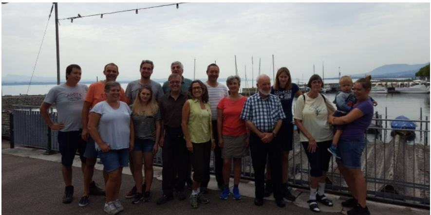
Reto Jemmi / Torro

Anschliessend ging es schon auf die Heimreise. Mowgli führte uns dem Neuenburger und Bieler See entlang, über den Col de Pierre-Pertuis und Moutier wieder in die Region Basel. Auch hier herzlichen Dank an Norsu und Mowgli für ein schönes Wochenende in der Romandie.