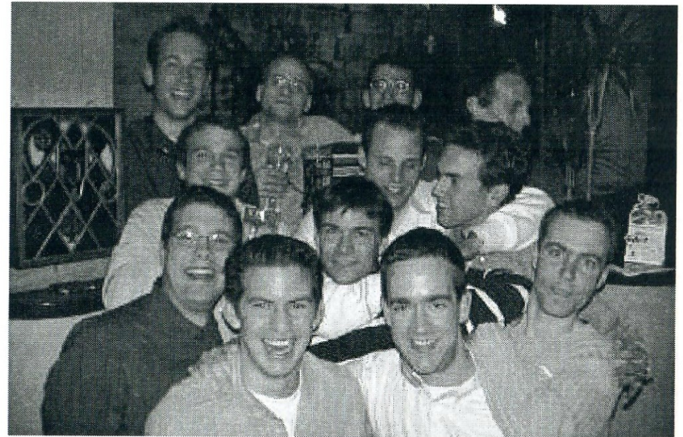
Ein Horn das einzige Mal vollzählig im Schnabel, Mai 2001