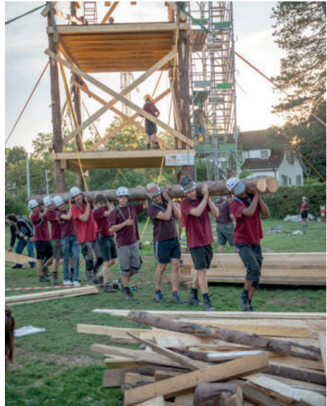
Dorffest 2025, Turm im Abbau