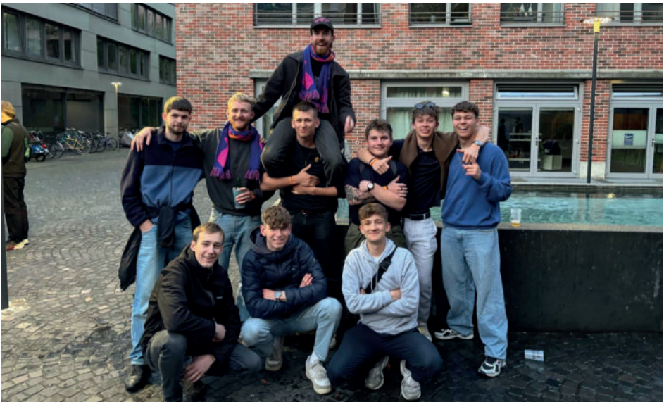
Rheinbandleiter, welche 2025 an Kursen teilgenommen oder Kurse geleitet haben