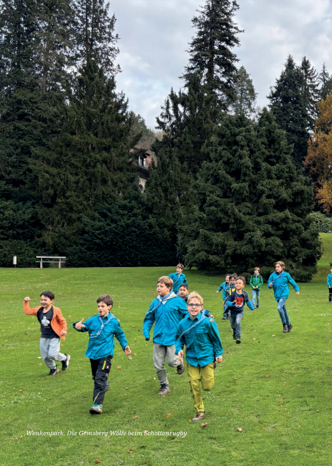
Wenkenpark, Die Gernsborg Wölfe beim Schottenrugby