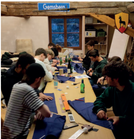
Rover Krawatte besticken im HZW

Nun freuen wir uns darauf, das Jahr gemeinsam bei den Waldweihnachten abzuschliessen und euch mit knusprigen Pizzas oder feinem Flammenkuchen aus dem Ofen zu verköstigen!