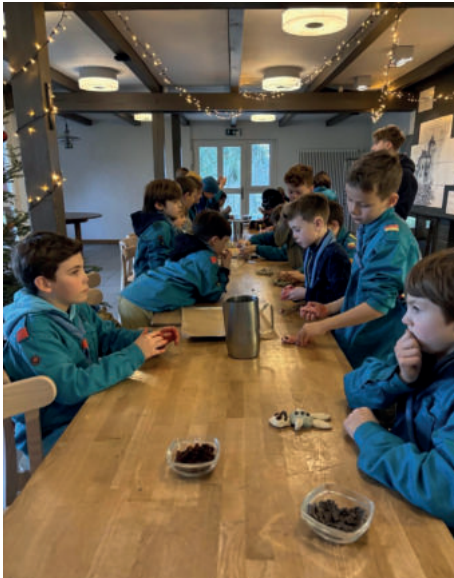
Die Wölfe beim backen im Rheinbundhaus

Nach einem geschickten Anschleichen nutzten die Rheinbündler den Überraschungseffekt, um den Grinch und seine Gehilfen zu vertrei-