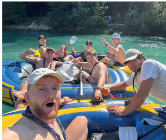
Aareböötle im August