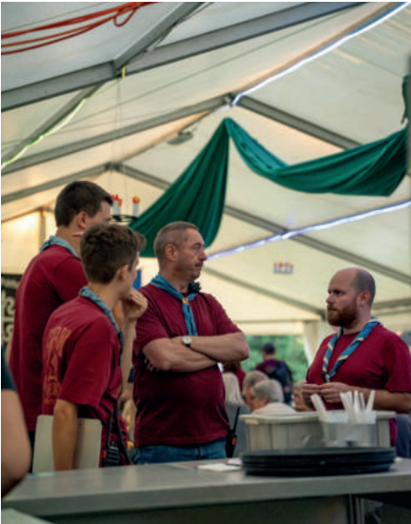
Dorffest 2025, OK Beiz

Nach Abschluss der offiziellen Geschäfte klang der Abend mit einer kleinen Feier für die zahlreichen Helferinnen und Helfer aus. Die gelungene Organisation dieses Anlasses unterstreicht das Engagement der Pfadi Riehen und galt als gelungene Generalprobe für das bevorstehende Dorffest im September.