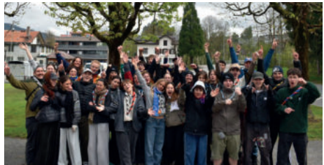
Aufbaukurs von Unimog und Ryō

Ein grosser Dank geht dabei an unseren APV, welcher unsere Kurse finanziert hat und somit auch die Aufrechterhaltung einer sauberen Planung ermöglicht hat!