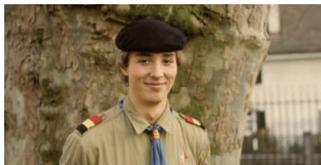
1982 Pause (StaFü Homberg)

Als Pause 1995 Obmann wurde, befand sich der Rheinbund mehr und mehr in einer schwieri-