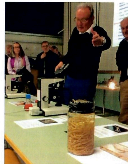
Reto Jemmi / Torro

Zur eigentlichen Generalversammlung sind wir dann ins Restaurant If d'or beim Alterszentrum Adullam gegangen. Weit über 50 Personen (!) sind an die diesjährige Führung und GV gekommen. Pfoschte hat zügig durch die Traktanden geleitet. Die Kasse und die Wahlen gaben nicht zu Diskussionen Anlass. Anschliessend hörten wir noch die Berichte aus der Abteilung (wo die Mitgliederzahlen wieder Freude machen), der Stiftung (wo die Sanierung der Dusch- und Waschräume ansteht) und dem Archiv (wo nun bald alle Dias digitalisiert sind). Bei einem feinen Nachtessen haben wir den Abend gemütlich abgeschlossen.